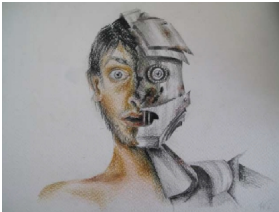
Disegno di Valeria Sonia Aufiero

In alto, al di sopra dell'intreccio di rami che filtrava la luce, la risata dolce, spensierata di un fanciullo accompagnò la disgregazione.