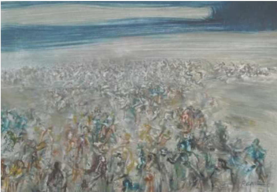
Evento Cosmico, monotipo di Angelo Ranzi