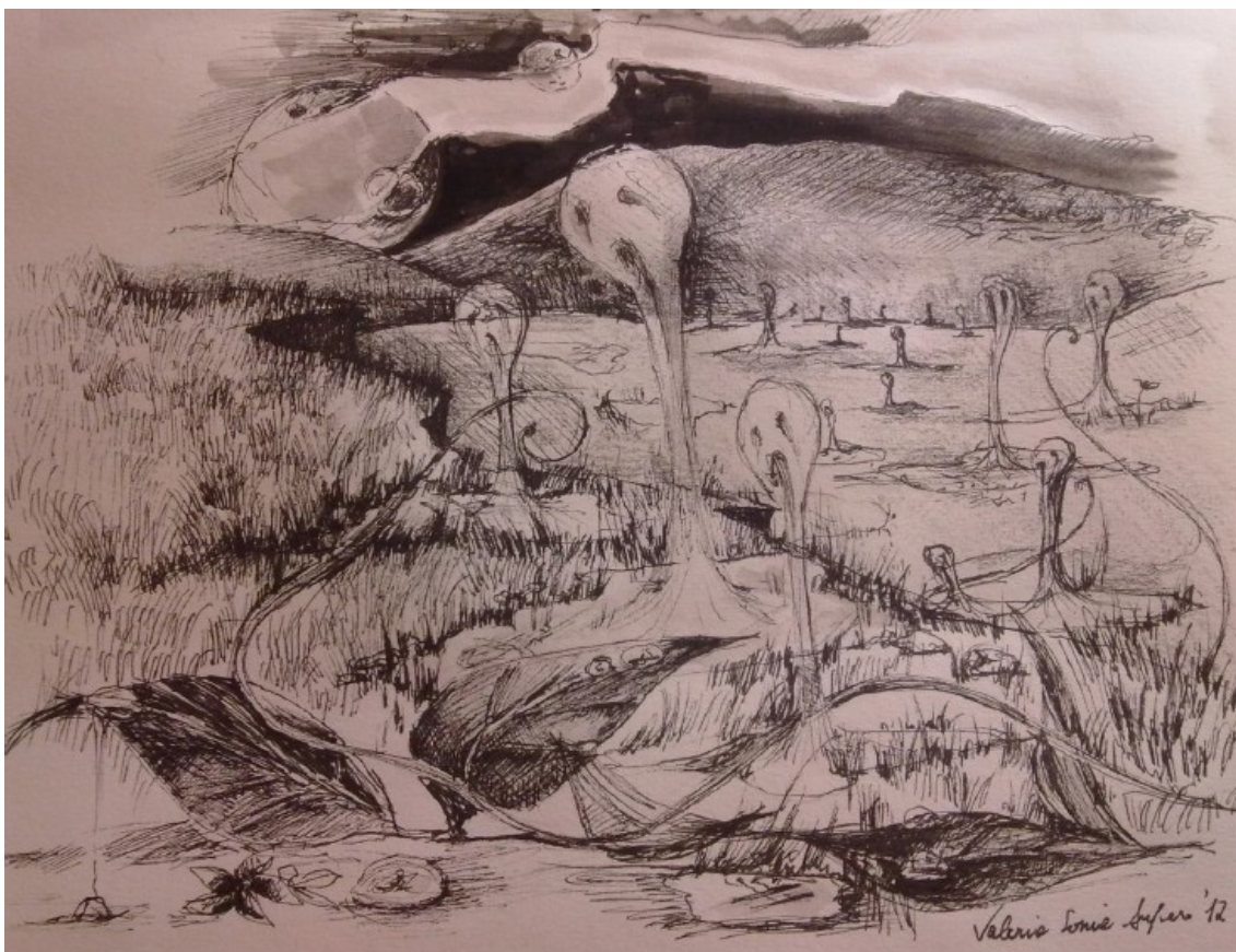
Disegno di Valeria Sonia Aufiero

Pensò di aver alzato un po' troppo il gomito, anche per quella sera.