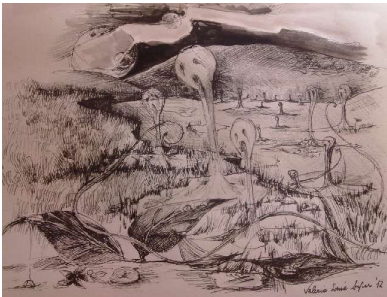
Disegno di: Valeria Sonia Aufiero